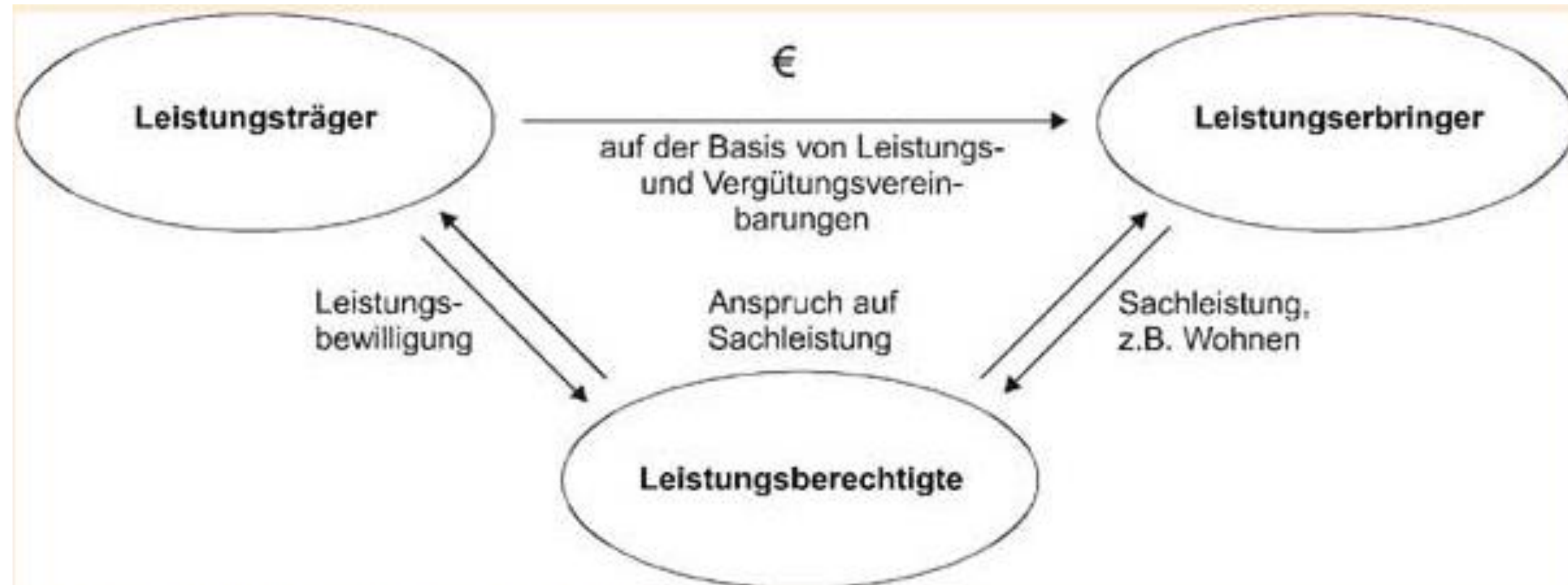
Abbildung: Die Beziehungen beim Sachleistungssystem

Quelle: Gemeinsam Leben - Gemeinsam Lernen. Verein zur Inklusion behinderter Menschen - Nürnberger-Land e.V. [text/html]. URL https://www.gemeinsamleben-nuernbergerland.de/unterschied.html (abgerufen am 12.04.2023).